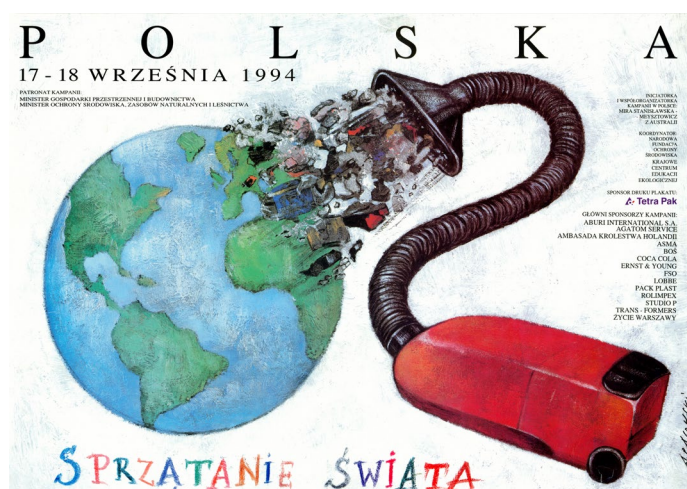
Plakat autorstwa Andrzeja Pągowskiego z 1994 roku.

Kiedy patrzymy na zaprojektowany w 1994 roku plakat autorstwa Andrzeja Pągowskiego, towarzyszący pierwszej Akcji Sprzątanie świata, widzimy przede wszystkim odkurzacz wyciągający z ogromną siłą śmieci z kuli ziemskiej. To niewątpliwie poruszające dzieło. Jednak pomimo widoku tej przerażającej góry odpadów, którą trzeba posprzątać, oglądając plakat, czujemy radość i podekscytowanie. Oto za chwilę, w trzeci weekend września, podobnie jak wolontariusze na całym świecie, wyjdziemy posprzątać Polskę z porzuconych w naturze śmieci. Kolorowe literki na plakacie, skreślone jakby ręką dziecka, układają się w napis „Sprzątanie świata”. Czujemy, jak wesoło podrygują w rytm wspólnej pracy uczestników Akcji na rzecz jedynej planety, jaką mamy do życia. Patrząc na tę znakomitą kompozycję, jesteśmy niemal pewni, że po Akcji będzie zdrowiej i czystiej. Upewniają nas w tym nakreślone ręką Mistrza błękity i zielenie, które wyłaniają się zza wyspanych przez odkurzacz ziemskich śmieci.